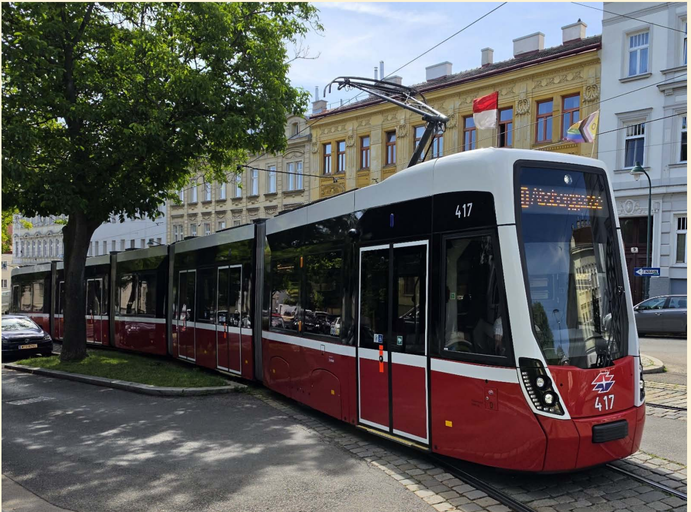
Ein Flexity bei der Einfahrt in die Endstation Nußdorf